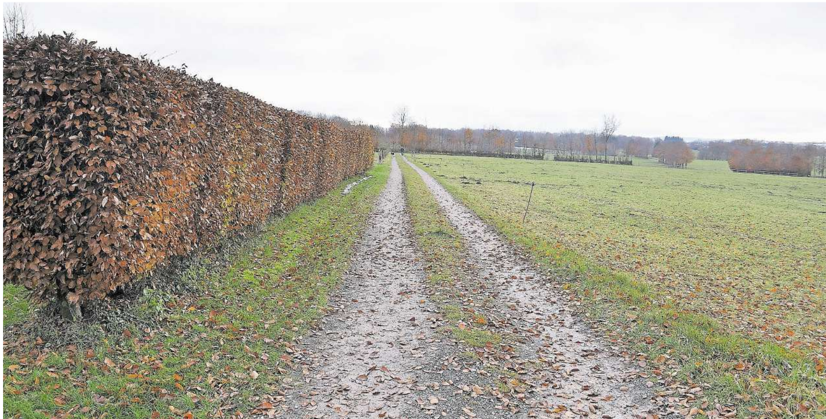
Dieser Wirtschaftsweg, der links vom Amselweg abzweigt, verläuft mitten durch das geplante neue Straucher Baugebiet „Südlich Weißenborn“. Seine Verlängerung in Richtung Breufeldstraße bildet die westliche Abgrenzung des Baugebiets.

Das Plangebiet erstreckt sich im rückwärtigen Bereich (von Simmerath kommend) links bzw. westlich der Kölner Straße (L246) und reicht vom Friedhof (Breufeldstraße) über die Verlängerung des Amselweges bis hin zu den letzten Häusern der Wohnstraße Auf der Hof. Bereits Ende 2011 hat der Planungsausschuss der Gemeinde erstmals darüber beraten, in diesem bisher landwirtschaftlich genutzten Bereich weitere Bauflächen zu entwickeln, doch erst im März 2015 wurde der zugehörige Bebauungsplan aufgestellt. „Vorrangig aufgrund der anhaltenden Nachfrage wird hiermit das Ziel verfolgt, im Gemein-